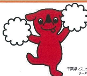
千葉県マスコットキャラクター チーバくん