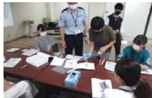
横浜税関 千葉税関支署 千葉税関支署でのしごと体験スクールの様子

海外から貨物が船で届き、輸入されるまでに、税関が担う様々な業務を模擬体験いただくことで、仕事の奥深さや楽しさを伝えています。