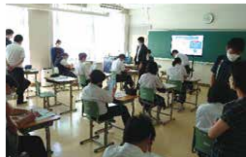
中央労働金庫 千葉県本部による 教育CSR実践授業の様子

模擬紙幣などを使った体験・参加型の授業を通じ、若年層が知っておくべき契約についての基礎知識や、消費者トラブルに巻き込まれないために必要なことなど、日常生活に役立つ授業を行っています。