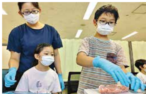
株式会社バル・ミート 工場見学会、お仕事(計量作業)体験の様子

「工場見学会」を開催し、普段口にしていない食べ物がどのような工程や品質管理の下で製造されているか、体験を通じた学習の機会を設けております。