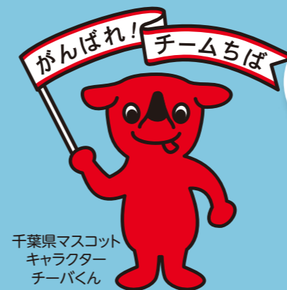
千葉県マスコット キャラクター チーバくん

模擬紙幣などを使った体験・参加型の授業を通じ、若年層が知っておくべき契約についての基礎知識や、消費者トラブルに巻き込まれないために必要なことなど、日常生活に役立つ授業を行っています。