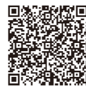
千葉県夢チャレンジ 体験スクール