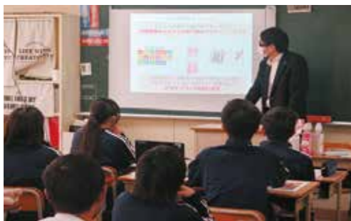
井関産業株式会社による 教育CSR実践授業の様子

SDGsの基本と、企業がどのようにSDGsに貢献しているのかを学びます。弊社製品で使用している再生PETボトルのパッケージをデザインする体験学習を行っています。