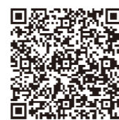
企業における 家庭教育支援講座

連絡先 千葉県教育庁教育振興部生涯学習課 学校・家庭・地域連携室 [TEL]:043-223-4069-4167 [FAX]:043-222-3565 [メール]:kysho2@mz.pref.chiba.lg.jp