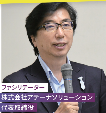
ファシリテーター